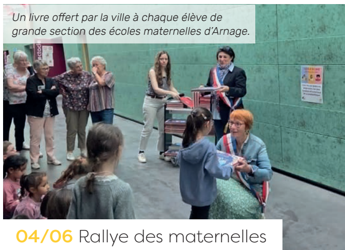
Un livre offert par la ville à chaque élève de grande section des écoles maternelles d'Arnage.