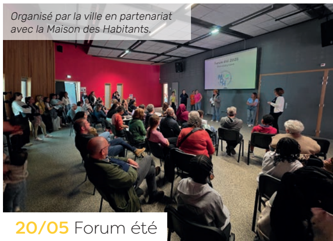
Organisé par la ville en partenariat avec la Maison des Habitants.