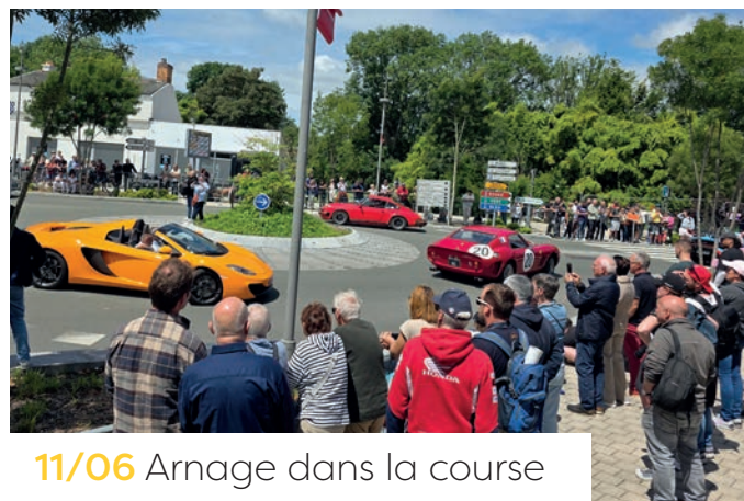
11/06 Arnage dans la course