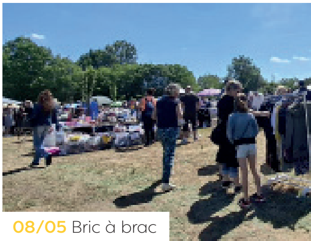
08/05 Bric à brac