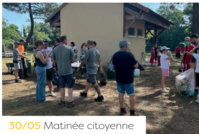
30/05 Matinée citoyenne